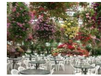
ウェルカムレセプション会場 神戸花園