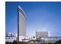
オフィシャルコンgresホテル 神戸ポートピアホテル