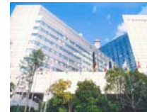
大会会場 神戸國際會議場