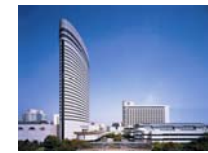
공식회장 호텔 神戸ポートピア 호텔